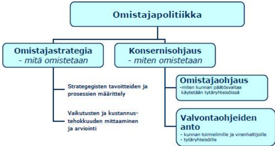
Kuva 1 Kuntayhtymän omistajapolitiikka ja konserniohjaus kuntien omistajapolitiikkaa soveltaen

Kainuun sosiaali- ja terveydenhuollon kuntayhtymän omistajaohjauksen keskeiset periaatteet ovat seuraavat: