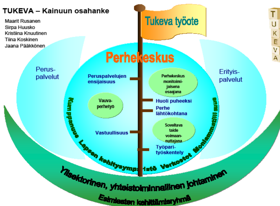
Kuvio 1. Kainuun osahankkeen kokonaisuus, Tukeva-paatti

Hankkeen toteutus ja kehittämistyö haluttiin viedä arjen ympäristöihin, perhekeskuksiin ja – asemille. Mukaan haluttiin saada mahdollisimman laaja työntekijöiden joukko kaikilta perheitä palvelevilta sektoreilta ja sitouttaa myös työyhteisöjen esimiehet hankkeen kehittämistyön taakse.